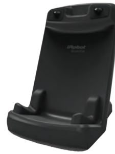
Optional erhältlich Lade- und Trockendock